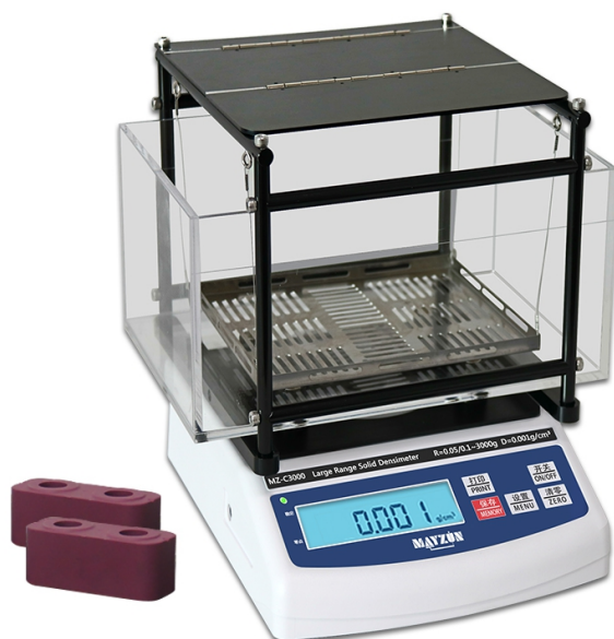
MZ-Y3000, 0.001g/cm 3 （尺寸可按需定制）