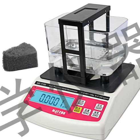
MZ-Y150, 0.0001g/cm 3 （配置专用防风防尘罩）