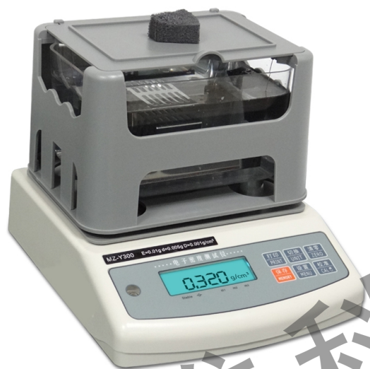
MZ-Y300, 0.001g/cm 3